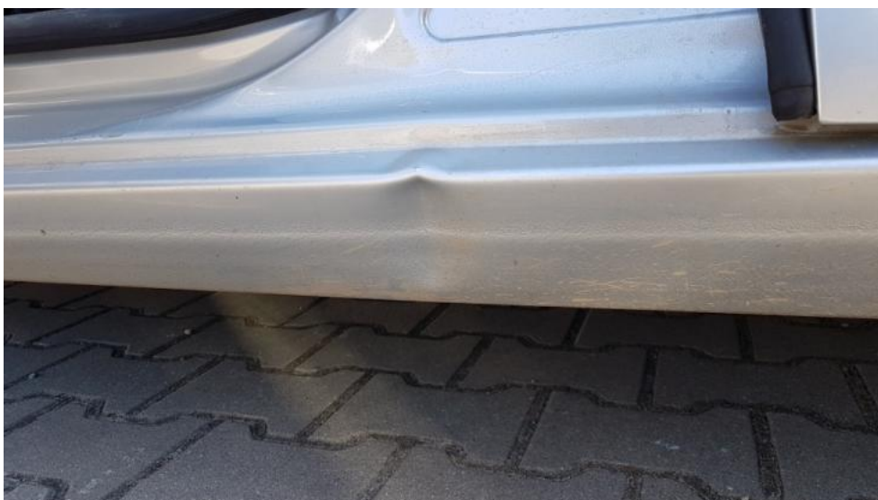
Fot. 40. Próg L - wgniecenie