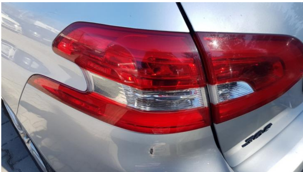
Fot. 33. Lampa TL - zarysowanie