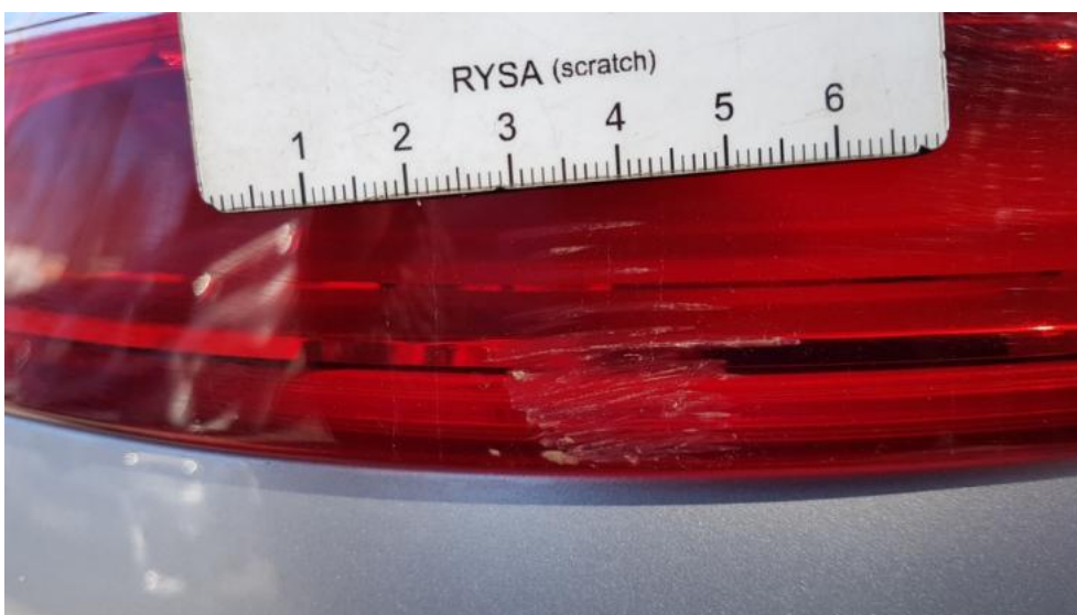
Fot. 34. Lampa TL - zarysowanie