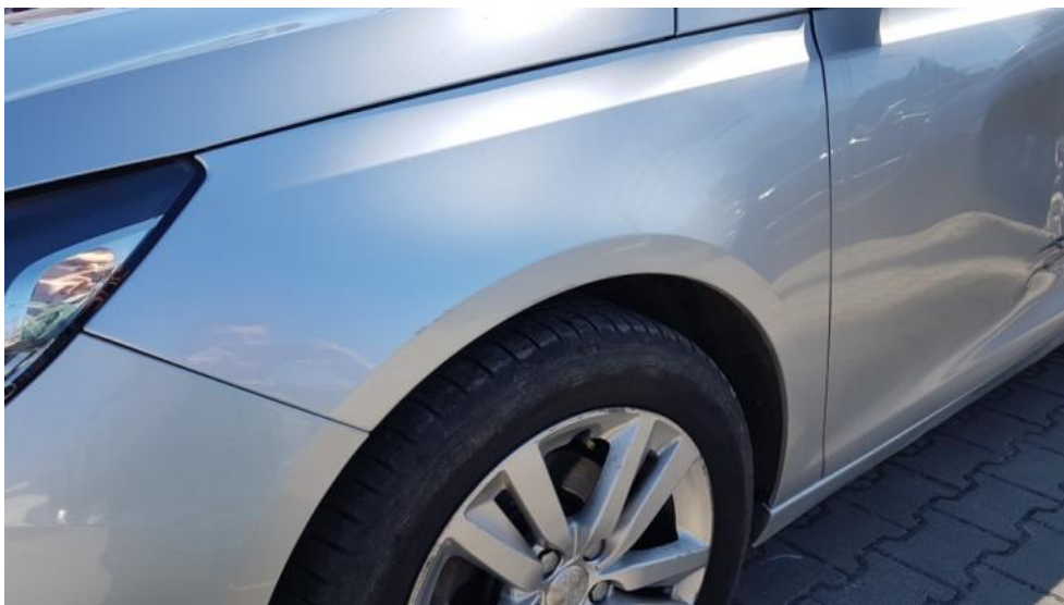
Fot. 43. Błotnik PL - zarysowanie