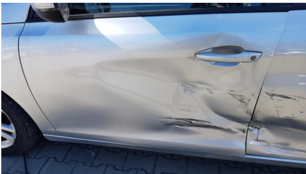
Fot. 42. Drzwi PL - wgniecenie/odkształcenie