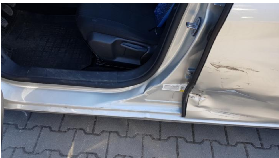
Fot. 38. Słupek śr.L - wgniecenie/odkształcenie