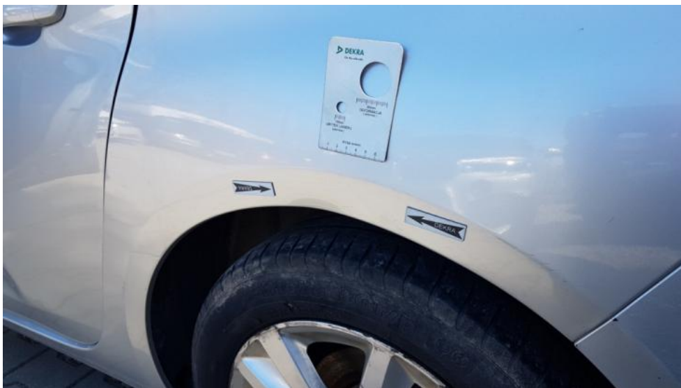
Fot. 35. Błotnik TL - wgniecenie