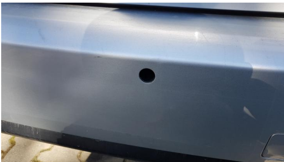
Fot. 32. Brak czujnika park. T