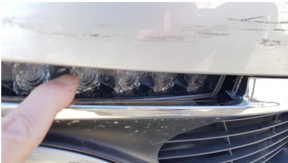
Fot. 27. Światło dzienne PP - poluzowane