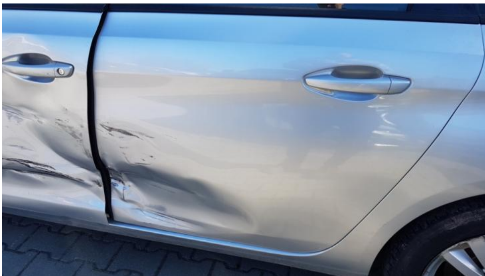
Fot. 41. Drzwi TL - wgniecenie/odkształcenie