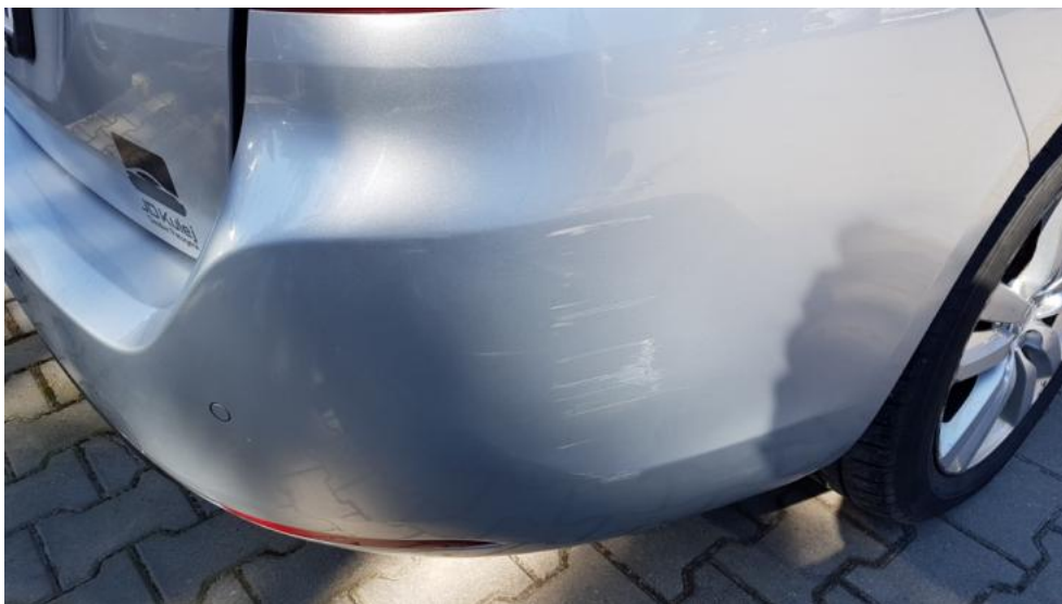
Fot. 31. Zderzak T - zarysowania/odkształcenia