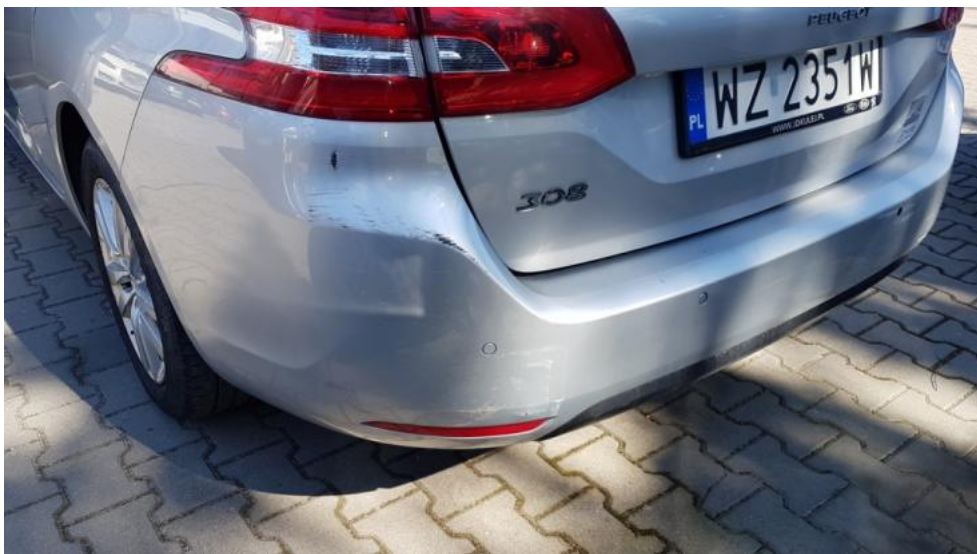
Fot. 29. Zderzak T - zarysowania/odkształcenia