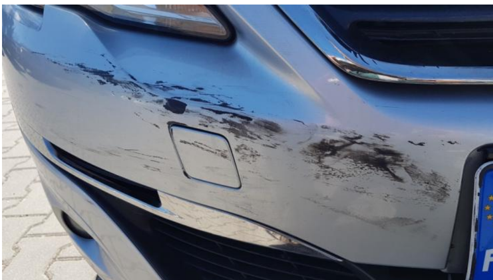
Fot. 26. Zderzak P - zarysowanie