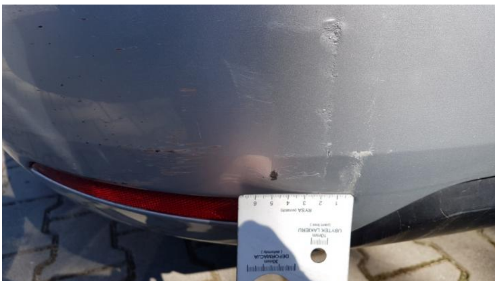
Fot. 30. Zderzak T - zarysowania/odkształcenia