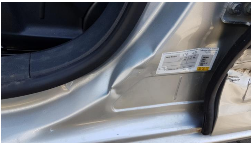
Fot. 39. Stupek śr.L - wgniecenie/odkształcenie