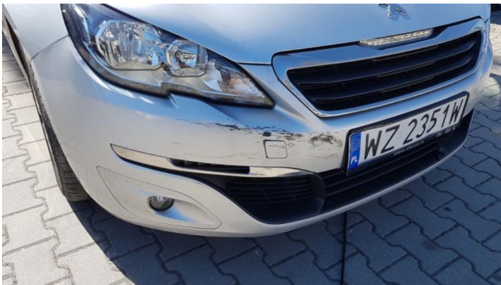
Fot. 25. Zderzak P - zarysowanie