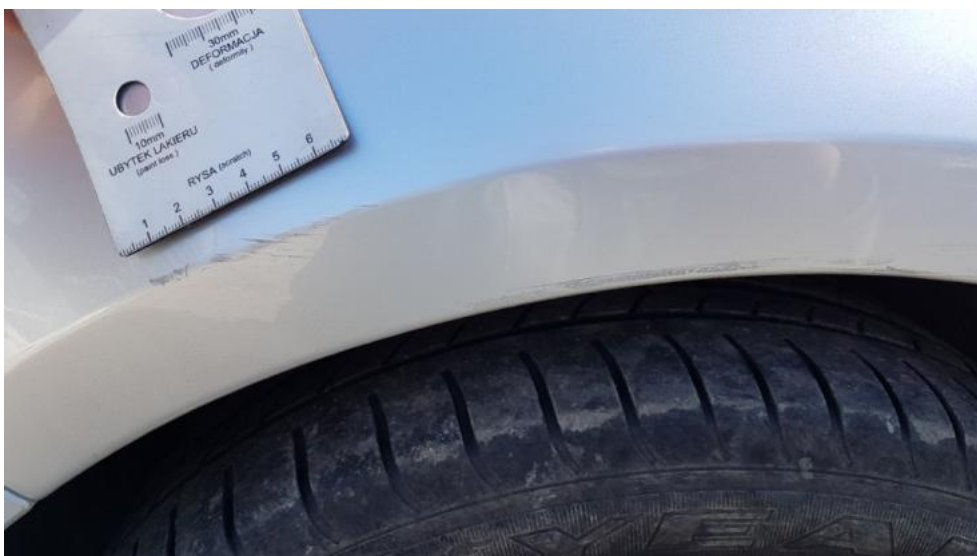
Fot. 44. Błotnik PL - zarysowanie