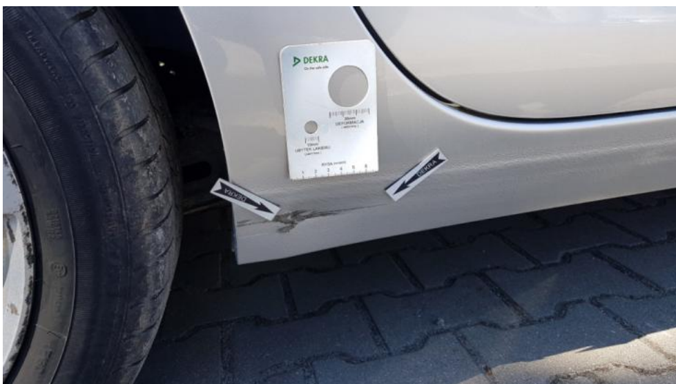
Fot. 28. Próg P - wgniecenie