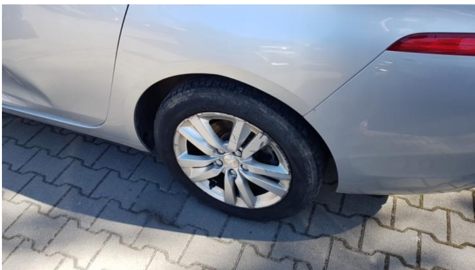
Fot. 36. Felga TL - zarysowanie