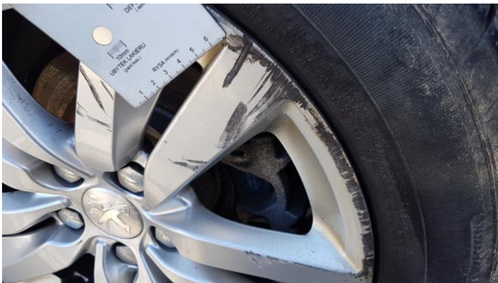
Fot. 37. Felga TL - zarysowanie